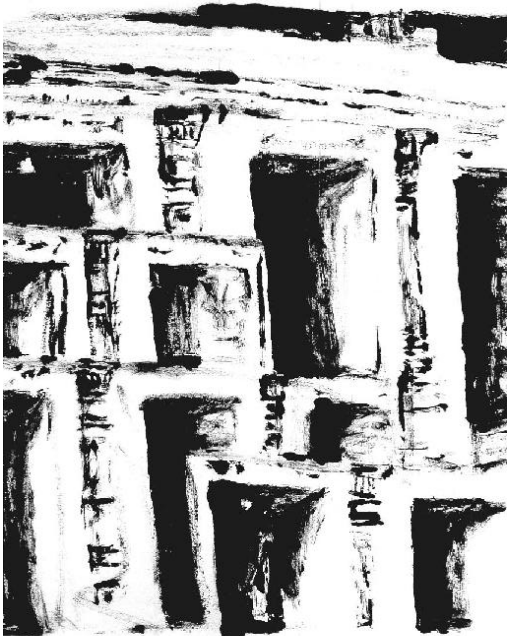
Ilustração: Isabele Zangiramo Fidellis

Palavras-chave: ciência; educação; autonomia; interdisciplinaridade; epistemologia educacional.