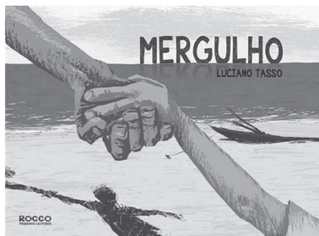
Figura 2 – Capa da obra Mergulho

A capa registra as mãos dadas do menino e do velho em direção ao mar, a sombra do menino e o mar ao fundo, conforme Figura 2. As imagens antecipam as personagens e o cenário em que ocorre a narrativa, contribuindo para a leitura. Ao associar o título Mergulho às imagens fornecidas pela capa, o leitor consegue pressupor o contexto narrativo e prever o que acontecerá no enredo.