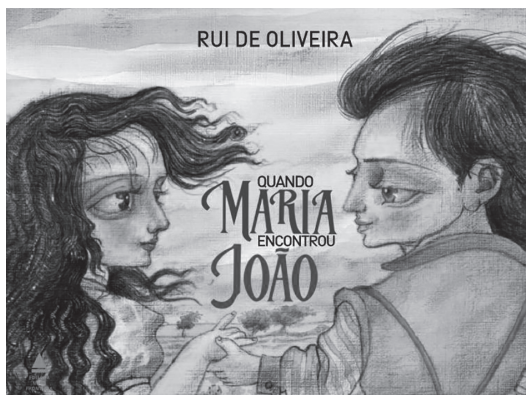
Figura 3 – Capa da obra Quando Maria encontrou João

A capa da obra destaca, de forma expressiva, os personagens principais ainda crianças, que dão início à narrativa, tendo ao fundo um gramado e o predomínio do céu, conforme Figura 3. Pelo olhar dos personagens, sugere-se que há um relacionamento significativo entre eles. A figura da capa revela o casal ainda criança e não após o reencontro, quando estavam mais maduros. Com isso, inferimos que um dos propósitos é valorizar os sentimentos aguçados na infância, aproximando o contexto narrativo à vivência dos adolescentes.