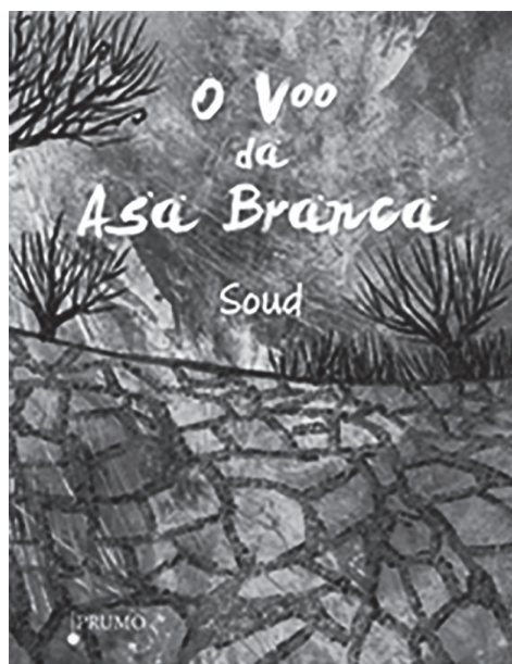
Figura 4 – Capa da obra O voo da Asa Branca

O paratexto da capa exhibe a imagem do sertão com tons terrosos, prevalecendo o ambiente árido, com árvores e vegetações secas, compostas apenas por galhos, conforme Figura 4. O título da obra e o nome do autor estão ao centro da capa na cor branca. Na capa, o leitor pode inferir o contexto da narrativa e as dificuldades pelas quais as personagens do sertão passam.