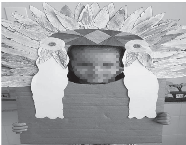
Figura 3 – Fotografia de atividade desenvolvida no Infantil III, Instituição B

Todavia, notamos que as atividades que envolvem as questões culturais são trabalhadas de forma fragmentada e estereotipada, como expresso na Figura 3.