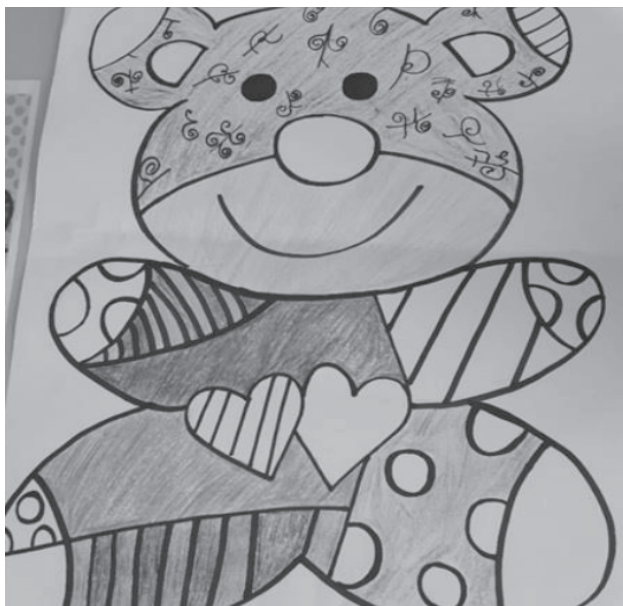
Figura 1 – Fotografia de atividade desenvolvida no Infantil I, Instituição “B”

Com base em realidades observadas, verificamos que para as professoras a efetivação do currículo ocorre no espaço interno das salas, pautada em atividades no papel que buscam, na maioria das vezes, o preenchimento do tempo, sendo comum a valorização das atividades registradas, folhas fotocopiadas, ações semelhantes às que ocorrem no ensino fundamental. O reconhecimento de números, letras e formas e a escrita do nome e sua identificação são tarefas enaltecidas por pais e professoras, pois mostrariam o que realmente as crianças estão aprendendo, revelando que a preocupação está no produto e não no processo de ensino. Nesse contexto, entendemos que a antecipação da escolarização descaracteriza a identidade da educação infantil, que “[...] é promover o desenvolvimento integral, em seus aspectos físicos, psicológicos, intelectual e social, complementando a ação da família e da comunidade” (Brasil, 1996). As Figuras 1 e 2 retratam um encaminhamento presenciado em uma das instituições pesquisadas.