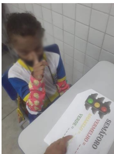
Figura 3 – Utilização da datilologia em momento de reflexão sobre a leitura e a escrita da língua portuguesa

Nesse sentido, chamamos a atenção para o Quadro 4, pois P4 faz menção ao uso da datilologia como estratégia de ensino da língua portuguesa escrita. Essa prática pode ser agregada às sugestões de estratégias apontadas por Quadros e Schmiedt (2006).