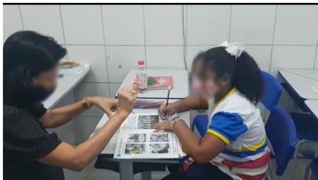
Figura 2 – Uso da datilologia como estratégia mediadora no processo de escrita da língua portuguesa

Na Figura 2, temos um print de um momento de gravação durante uma aula síncrona pelo Google Meet, após o retorno à escola, ainda durante a pandemia de covid-19, em que a professora utiliza a datilologia como estratégia para a criança surda escrever.